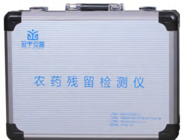
图 3（仪器主机箱外观图）