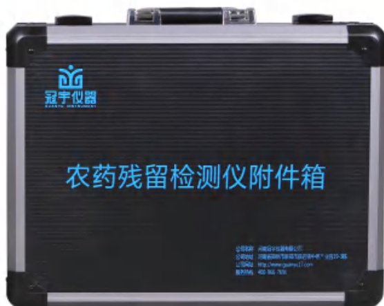
图 2（仪器附件箱外观图）